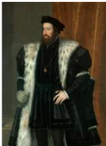
Фердинанд Габсбург . Император Священной Римской империи