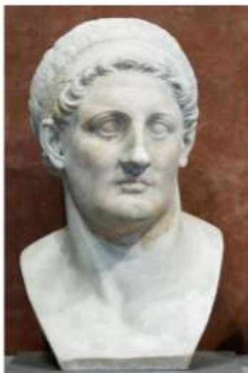
Пталомей II Сотер (Лувр.Париж)